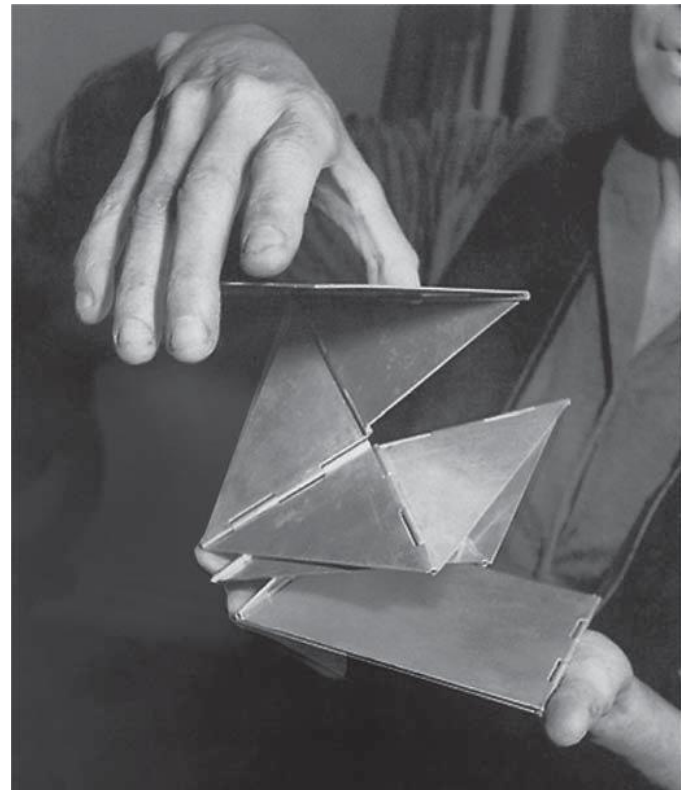
CLARK, L. Bicho de bolso . Placas de metal, 1966.

O objeto escultórico produzido por Lygia Clark, representante do Neoconcretismo, exemplifica o início de uma vertente importante na arte contemporânea, que amplia as funções da arte. Tendo como referência a obra Bicho de bolso , identifica-se essa vertente pelo(a)